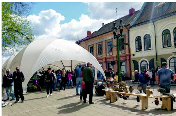
■ Laukia: rudenį Kaunas pasitinka su autentiška muzika, teatro improvizacijomis ir cirko magija.

Mugės metu bus išmokyti režisierės Inos Pukelytės spektaklio „Brendžio trims. Po dešimt metų“ premjerą improvuojamos