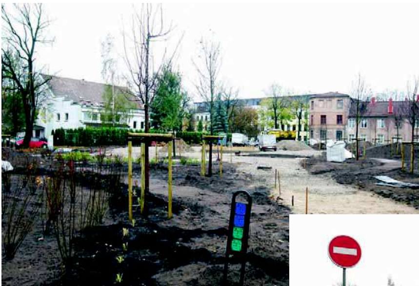
■ Darbai: Vydūno skveras keičiasi – seni medžiai iškirsti, paklotos komunikacijos, pasodinta dauguma augalų.